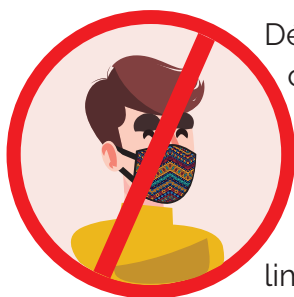
masque en tissu non autorisé

En matière de lois sur les médias, la majorité des professionnels des médias reconnaissent que le Bénin dispose des meilleurs textes de lois sur l'accès à l'information mais son application fait très souvent défaut. Bien qu'aucune décision de régulation, ou encore un texte de loi ne limite l'accès aux informations sur la COVID-19, il est important de préciser que le code de l'information et de la communication a prévu des sanctions sur la publication de fausses informations.