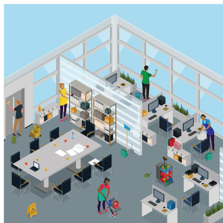
nous avons désinfecté nos bureaux par nous-mêmes

En revanche, pour ceux qui en ont les moyens, ils se sont procurés le dispositif des lavages des mains recommandé par l'Etat.