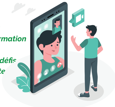
Entretien réalisé numériquement